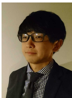
設計担当：(有) 辺見設計 代表取締役 邊見 啓明氏

私たちは、岩江の棚田を舞台として、土地の持つ潜在力を十分に活かしたいと考えました。棚田、果樹の木、丘陵地という三春町特有の風景の中で、子どもたちがイキイキと活動し、一人一人の感性を大切に施設づくりを心掛けました。子どもたちの様々な体験と記憶を通して心の原風景に残る園舎を目指すに当たり、4つのコンセプトで設計に取り組み、現在工事を進めております。